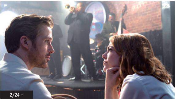
Sebastian (Ryan Gosling) and Mia (Emma Stone) in LA LA LAND.