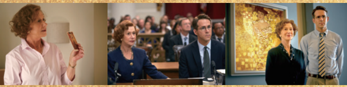
「黄金のアデーレ 名画の帰還」